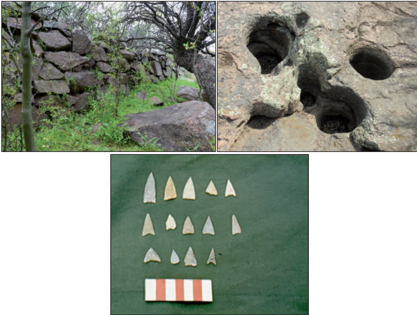
Figura N° 2. Represa, morteros y puntas de flecha